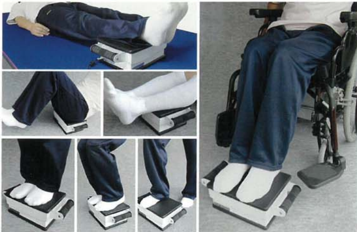
※使用者により、負荷が変えられます!